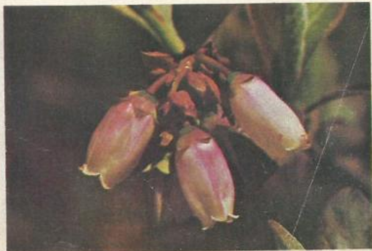
Flores de arándano